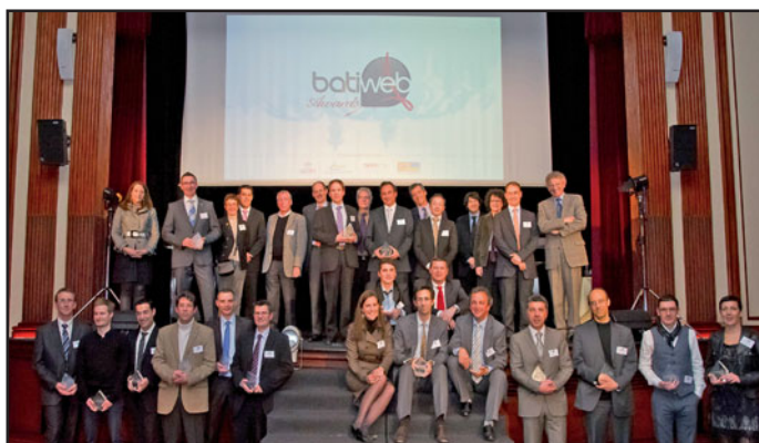
Les 20 lauréats du concours des Batiweb Awards

Au cours de l'année 2010, les internautes, qu'ils soient professionnels ou industriels du B.T.P, ont élu leurs produits favoris parmi 20 catégories de produits du bâtiment. C'est au sein de l'établissement "Select Automobile Club de France" Place de la Concorde (Paris) que le groupe Batiweb a organisé, le lundi 31 janvier 2011, la cérémonie annuelle des Batiweb Awards afin d'honorer les lauréats du