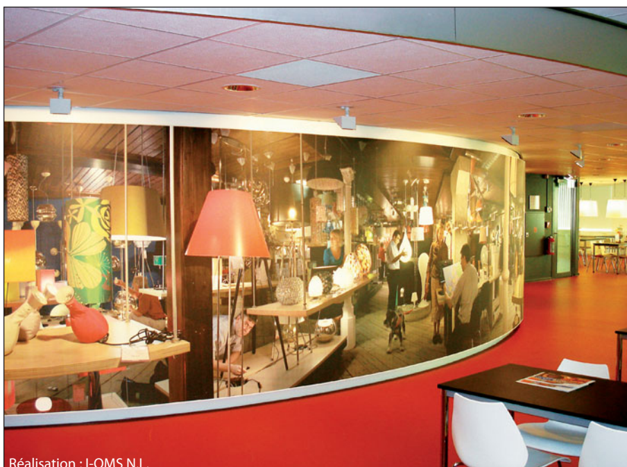
Réalisation : I-OMS N.L.

Elles sont faciles et rapides à assembler grâce aux profilés P-CPA68 (ou P-CRA67) associés à des revêtements Clipso. Dotées de pieds fixes en aluminium de forme arrondie ou rectangulaire, les cloisons Clipso sont légères, décoratives et stables. Il est également possible de les accrocher grâce à notre gamme de suspensions.