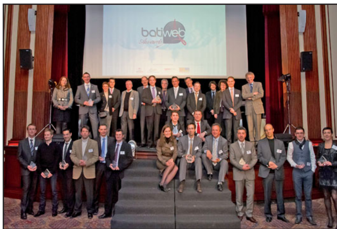
Die 20 Preisträger der Batiweb Awards

Fachleute und Unternehmer aus dem Hoch- und Tiefbau konnten im Jahr 2010 online über die besten Bauprodukte in 20 Kategorien abstimmen. Am Montag, den 31. Januar 2011 veranstaltete die Batiweb-Gruppe schließlich die jährliche Verleihung der Batiweb Awards in den