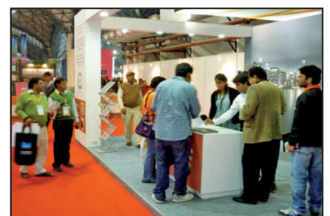
Clipso Stand auf der Acetech in Neu Delhi vom 17. bis 19. Dezember 2010